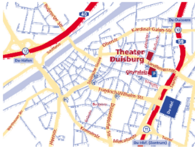
Liebfrauenkirche: vis a vis vom Theater Duisburg