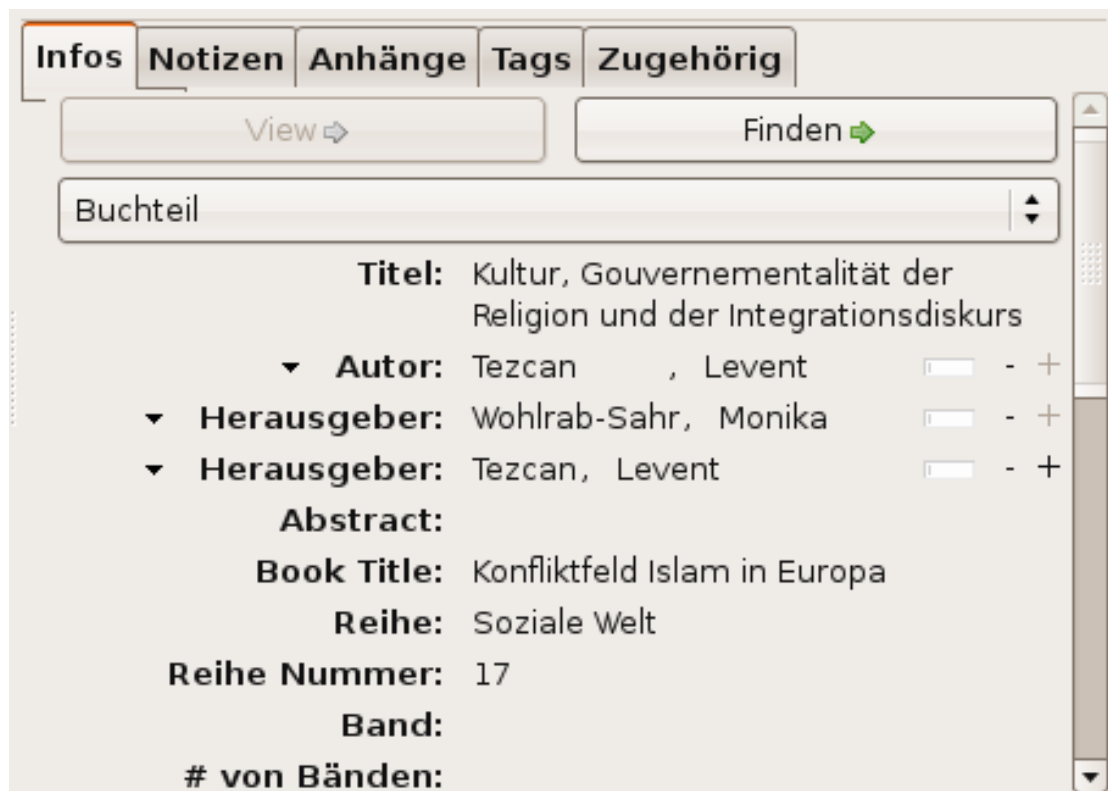
Abbildung 7.1: Eintrag in einer Literaturdatenbank